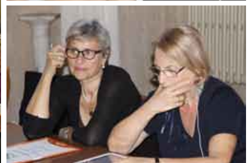
Roma: Sessione della Famiglia Vincenziana Europea (5-7 ottobre 2012)