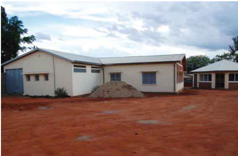
Ihosy: l'ambulatorio dentistico e oculistico in fase di allestimento

Un progetto in sospeso, ma praticamente già concluso nella parte logistica è il Centro Sanitario di Ihosy. La casa di ospitalità per il medico e la sua famiglia è già pronta. Il blocco operatorio, che è il cuore della struttura è materialmente a posto. Questo Centro sarebbe già pronto, ma attualmente ci sono due difficoltà, che lo fanno andare a rilento. La prima è il reperimento di un medico stabile. La difficoltà nasce dal fatto che Ihosy è un piccolo centro ed i medici normalmente cercano di fare carriera, aspirando a posti più rinomati nella capitale: finora non si è riusciti ad attrarre in maniera permanente un medico, per cui il Centro anche per la parte per cui è pronto non riesce a funzionare in maniera adeguata.