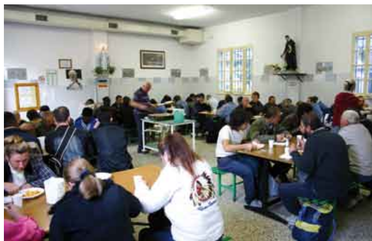
Una delle tante mense gestite dai servizi vincenziani in Italia

“Queste persone - osserva il sottosegretario Maria Cecilia Guerra - non sono invisibili. Le vediamo, ma le guardiamo con occhi sbagliati: l'idea che dietro la loro condizione ci sia una scelta o una colpa mette in pace le nostre coscienze. Non si diventa senza fissa dimora per caso, si tratta di percorsi in cui tutti potremmo incorrere, se ci dovesse capitare la perdita di una rendita sicura mediante il lavoro o una separazione del nucleo familiare”.