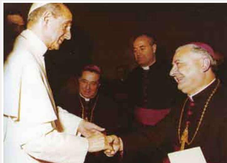
Incontro di Paolo VI con mons. Bugnini

Le memorie autobiografiche di Padre Bugnini aprono ora uno scenario che sconvolge tutte queste illazioni e restituiscono alla verità storica quelle informazioni che aiutano a riscoprire quanto grande sia stato il contributo di questo nostro confratello alla Riforma Liturgica . E soprattutto rivelano un ritratto a tutto tondo della sua spiritualità vincenziana, fatta di umiltà, semplicità, amore alla sopportazione delle calunnie per amore di Cristo e della Chiesa.